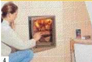
4 Nach dem Einheizen kann die Fülltüre geschlossen werden. Die Luftzufuhr bleibt geöffnet.