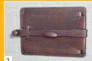
3 Wenn über dem Glutstock nur mehr kleine Flämmchen auftreten, kann abgesperrt werden - d.h. die Fülltüre ist zu schließen. Öffnen Sie die Fülltüre erst wieder nach 12 Stunden.