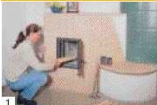
1 Holz im Brennraum kreuzweise aufschichten und die Luftzufuhr öffnen.