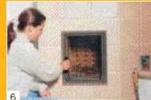
6 Wenn über dem Glutstock nur mehr kleine Flämmchen auftreten, kann abgesperrt werden - d.h. die Luftzufuhr ist zu schließen. Öffnen Sie die Fülltüre erst wieder nach 12 Stunden.