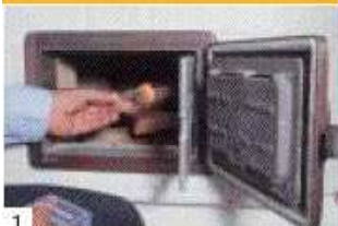
1 auch hier: Holz kreuzweise aufschichten.