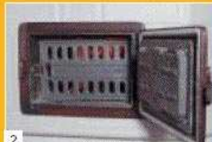
2 nach dem Anzünden ist der Stehrost zu schließen, die Tür bleibt offen.