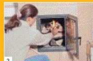
3 Bei viel Holz die Scheite dicht schichten und im oberen Drittel anzünden.