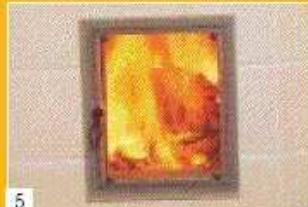
5 Der Verbrennungsvorgang dauert je nach Holzmenge 1/2 bis 1 1/2 Stunden.